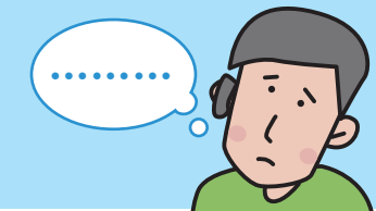
コミュニケーションカード 05