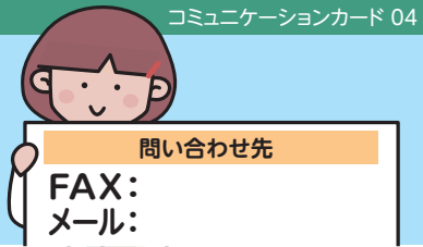
コミュニケーションカード 04