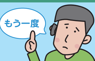
コミュニケーションカード 06